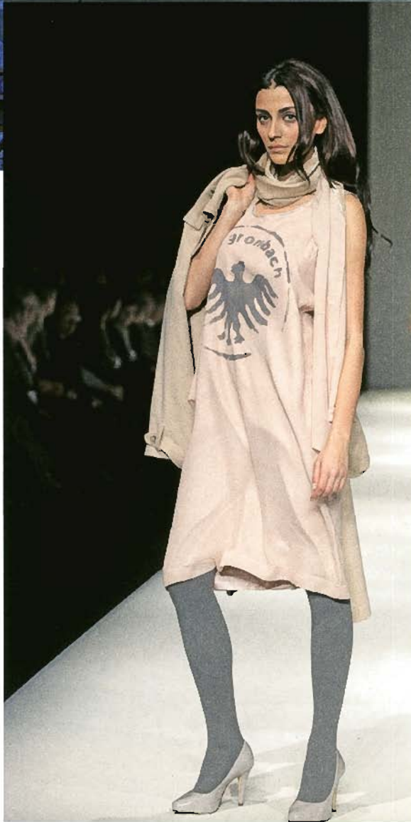
Modedesign „made in Germany“