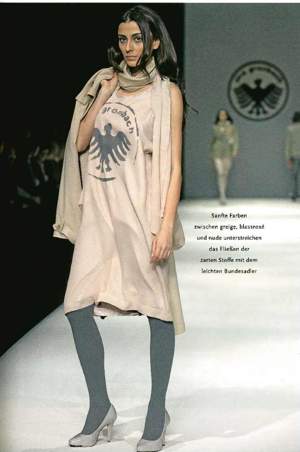
Sanfte Farben zwischen greige, blassrosé und nude unterstreichen das Fließen der zarten Stoffe mit dem leichten Bundesadler