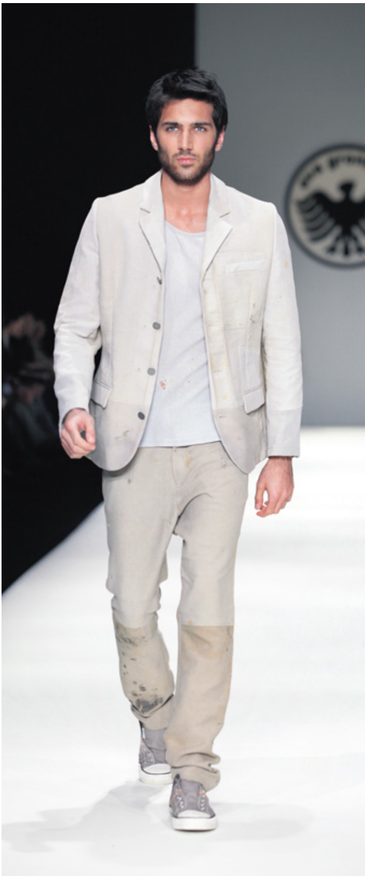
In Istanbul zeigte die Kölner Designerin ihre „German-Jeans“-Kollektion, bei der sie original getragene Bergmannskleidung aus dem Ruhrgebiet in modernes Design verwandelt.